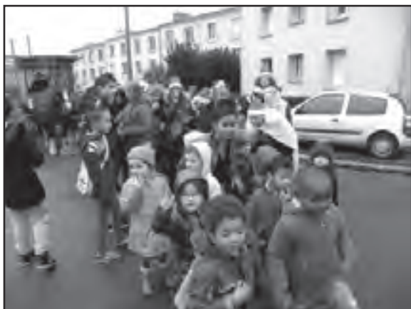
Comimtion Vie de Quartier

Ce qui laisse une année au Père Noël pour se reposer, et à l'ensemble des partenaires pour réfléchir à la prochaine édition.