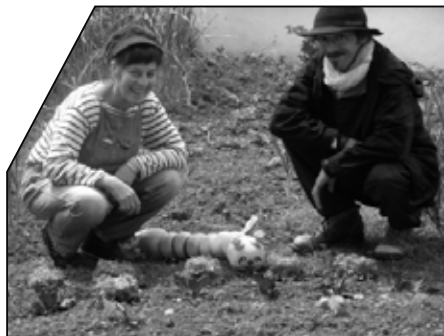
Choupenn la chenille

Mercredi des histoires, 15h30, le 17 décembre: gratuit sur inscription.