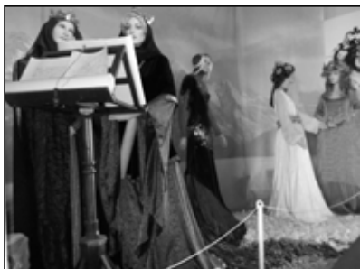
Le monde imaginaire au château de Comper à Concoret