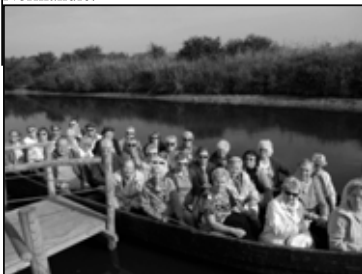
Balade sur les chalands