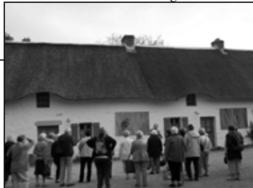
Maison au village de Kerhinel