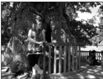
Notre guide auprès de l'arbre guillotiné

Le samedi direction Quelneuc (à 40mn de Vannes) pour une journée d'accrobranche et de laser game en plein air pour les jeunes de 8 à 18 ans. Une journée au grand air riche en émotions.