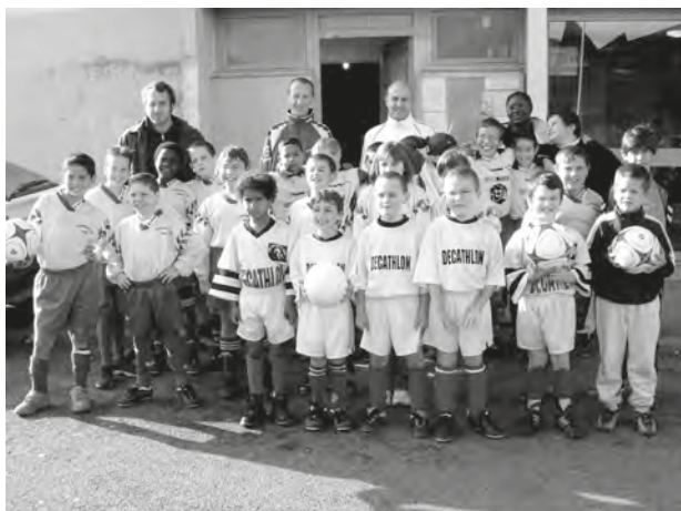
Du temps à passer entre ces deux photos